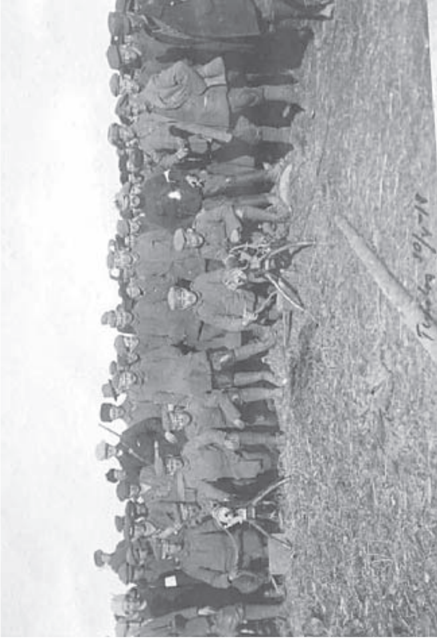
Saksalaisia koneiväärimiehiä ja suojeluskuntalaisia yhteiskuvassa taistelujen tauottua Tuuloksessa 30.4.1918.