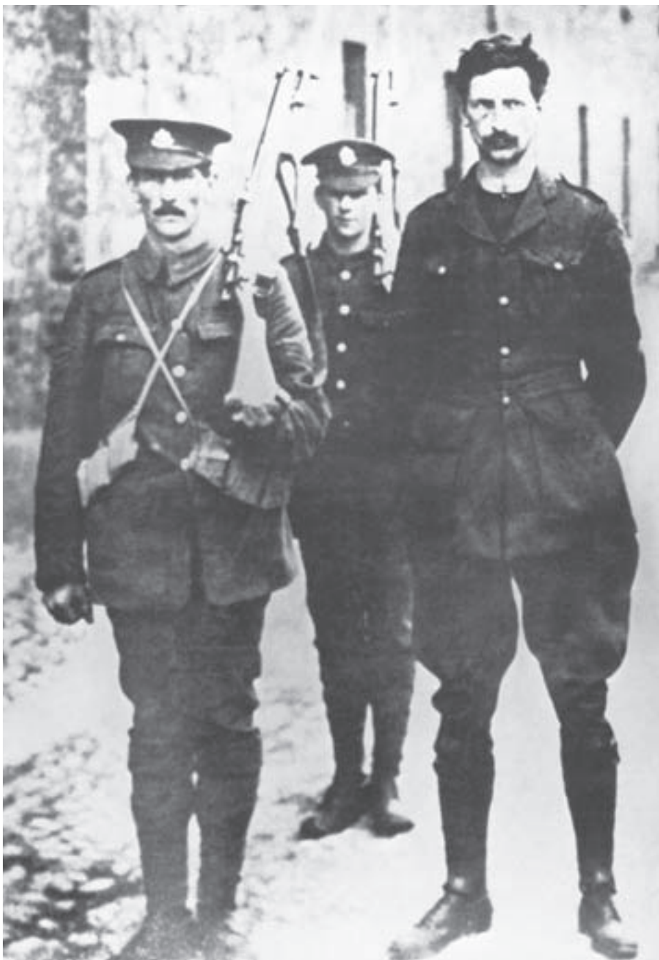
Brittisotilaat vangitsemassa Eamon de Valeraa, yhtä vuoden 1916 pääsiäiskapinan johtajista Dublinissa.