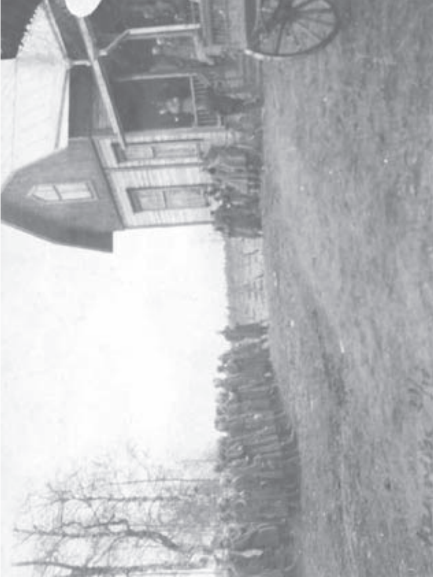
Uskonnolla oli nationalismin ohella keskeinen asema aikakauden kansallismielisten liikkeiden taistelumoraalin nostajana. Suojeluskuntalaisten jumalanpalvelus Kauvatsalla 21.4.1918.