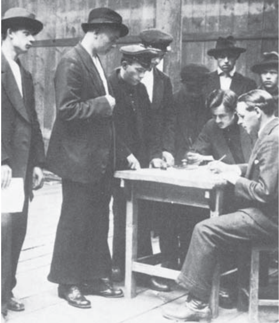
Nuoria vapaaehtoisia värväytymässä puna-armeijaan Moskovassa alkuvuodesta 1918.