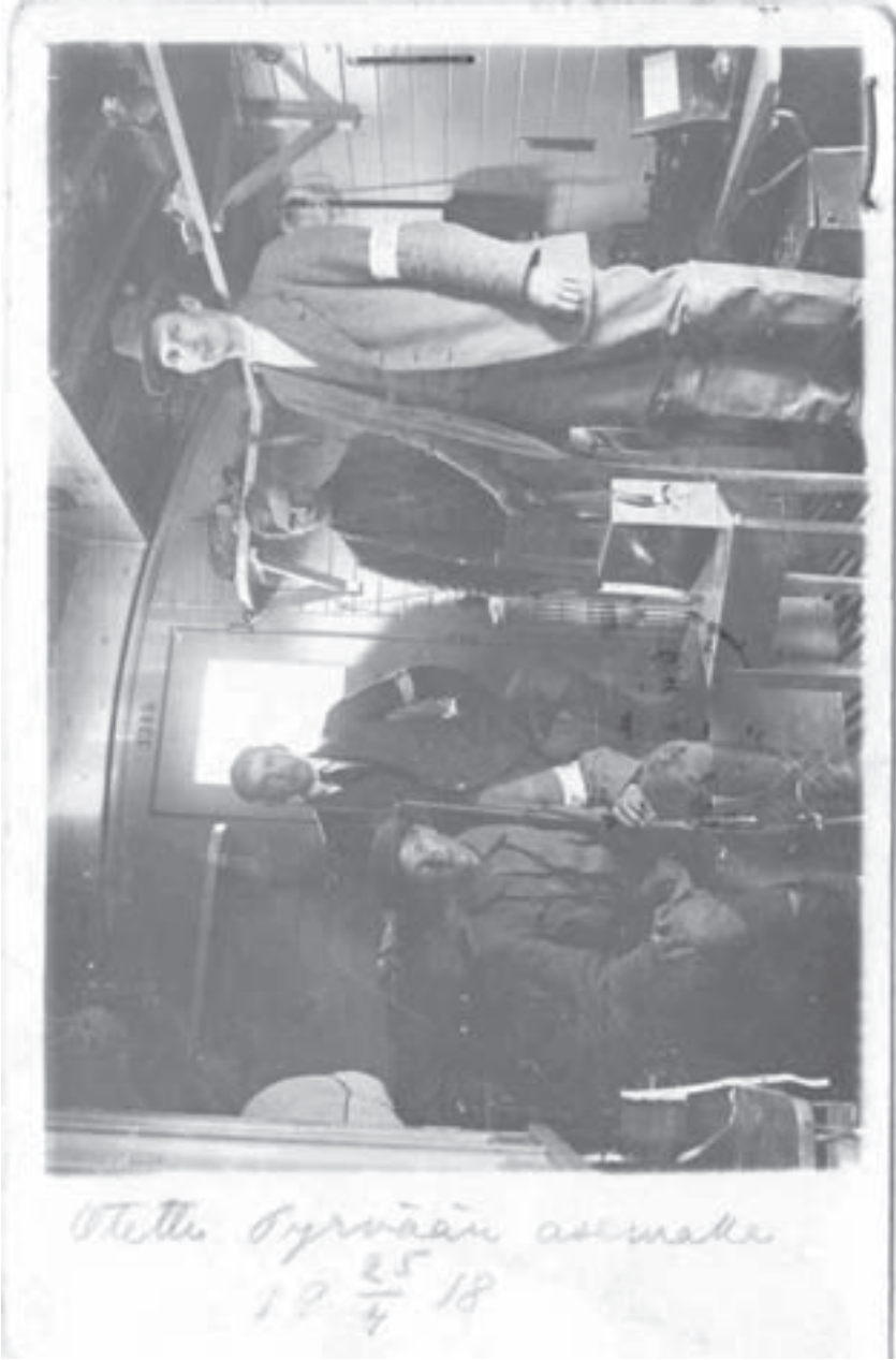
Valkoista esikuntaa viestivälineiden ympäröimänä rautatievaunussa Tyrnävän asemalla 25.4.1918. Sodan osapuolten tärkeimmät sotilasmaailiset tavoitteet liittyivät itä-länsi suuntaisten runkoratojen hallintaan ja puhelin toimi Suomen oloissa ensimmäistä kertaa tärkeimpänä viestinvälittäjänä.