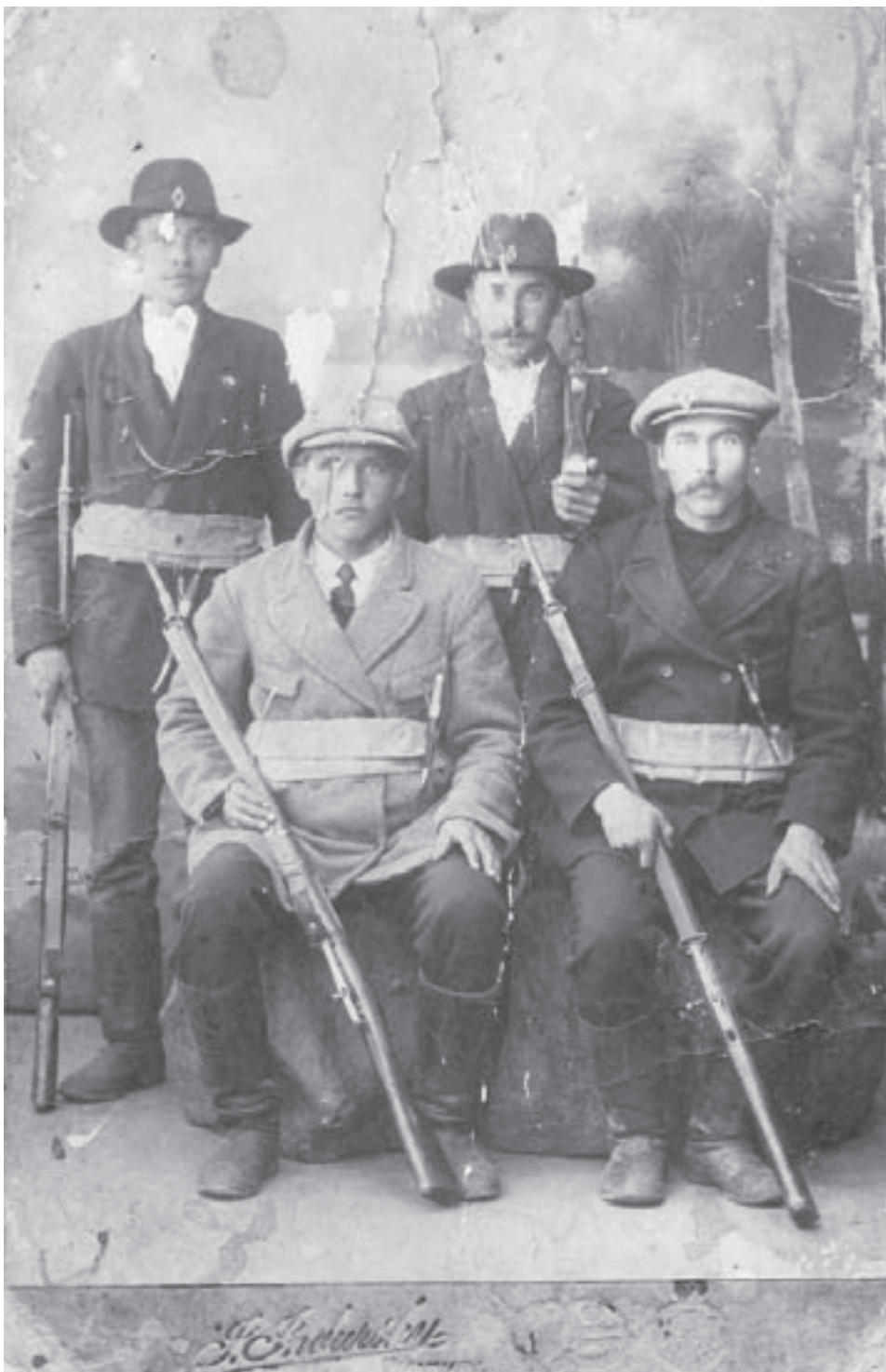
Heinjokilaisia suojeluskuntalaisia sotilaskivääreineen vuonna 1918. Univormuista ei ole vielä tietoakaan.