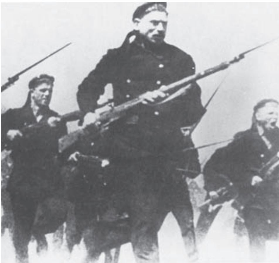
Punaisia merisotilaita hyökkäämässä Baltian valkoista armeijaa vastaan vuonna 1919.