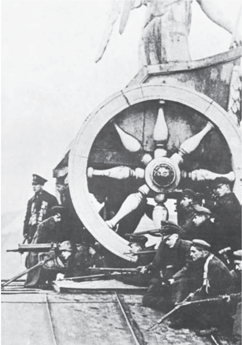
Sekalainen joukko sotilaita valvomassa Brandenburgin porttia Berliinissä marraskuun 1918 vallankumouksen aikoihin.