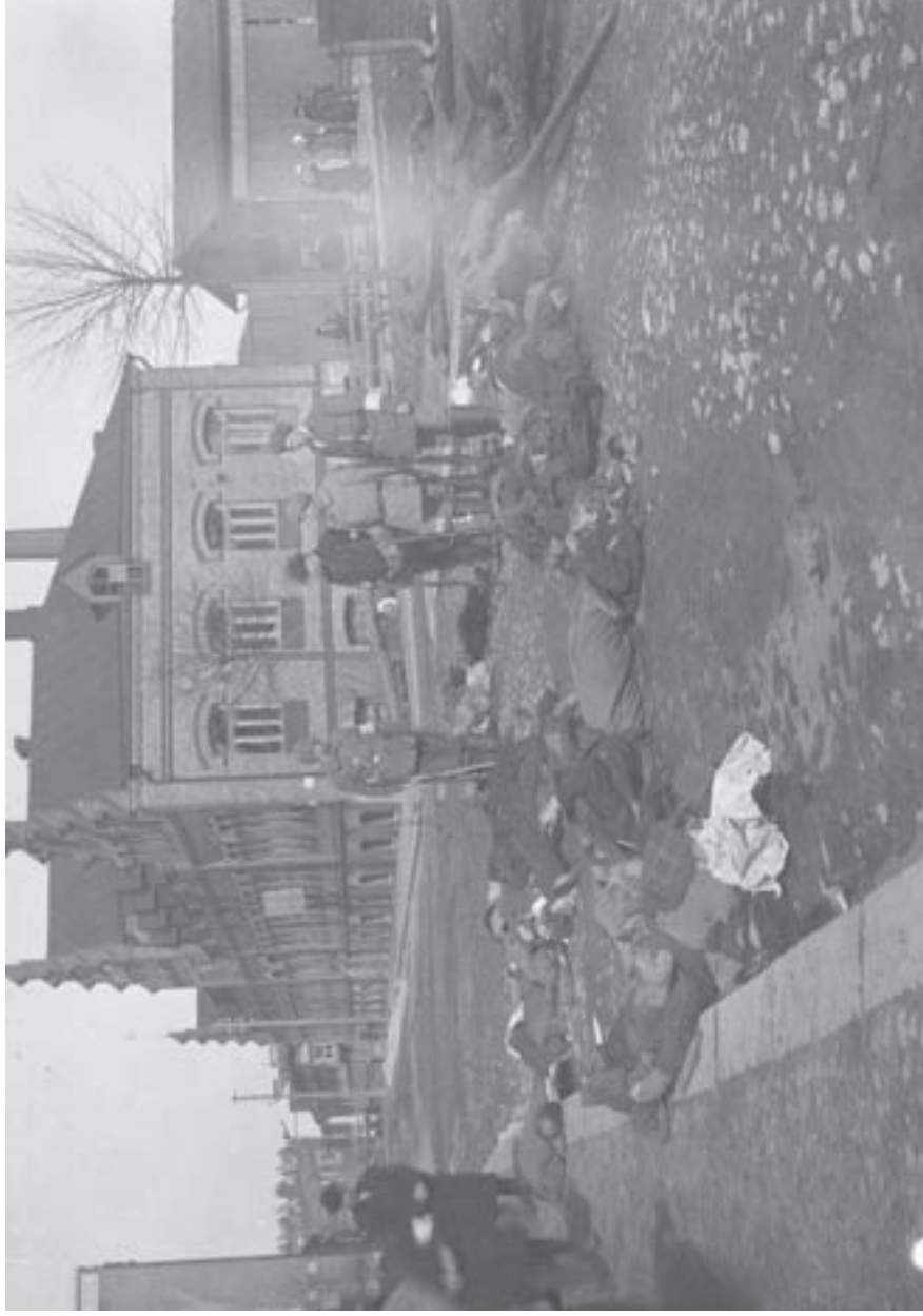
Punaisten ruumiita Tampereen Tammelan torin vieressä huhtikuun alussa 1918.