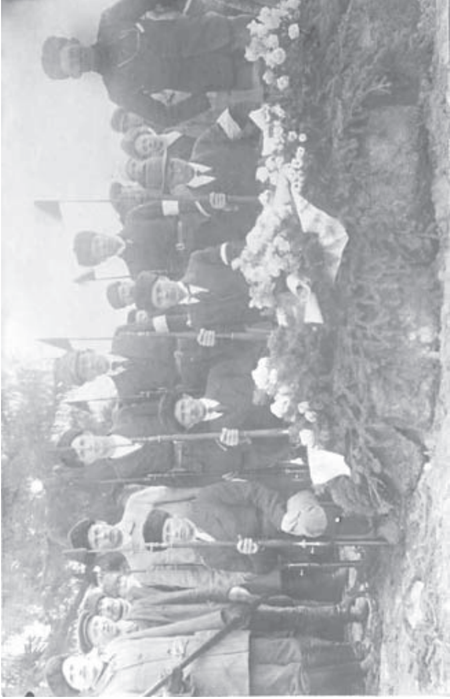
Valkoisten hautaustilaisuus Juvassa maaliskuussa 1918. Kunnivartioiden ja kukkavuorien osalta osapuolten sankarihautajaiset eivät juuri eronneet toisistaan.