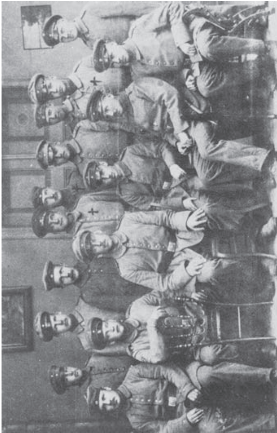
Jääkäreitä saksalaisissa univormuissaan itärintamalla Liepajassa vuonna 1917.