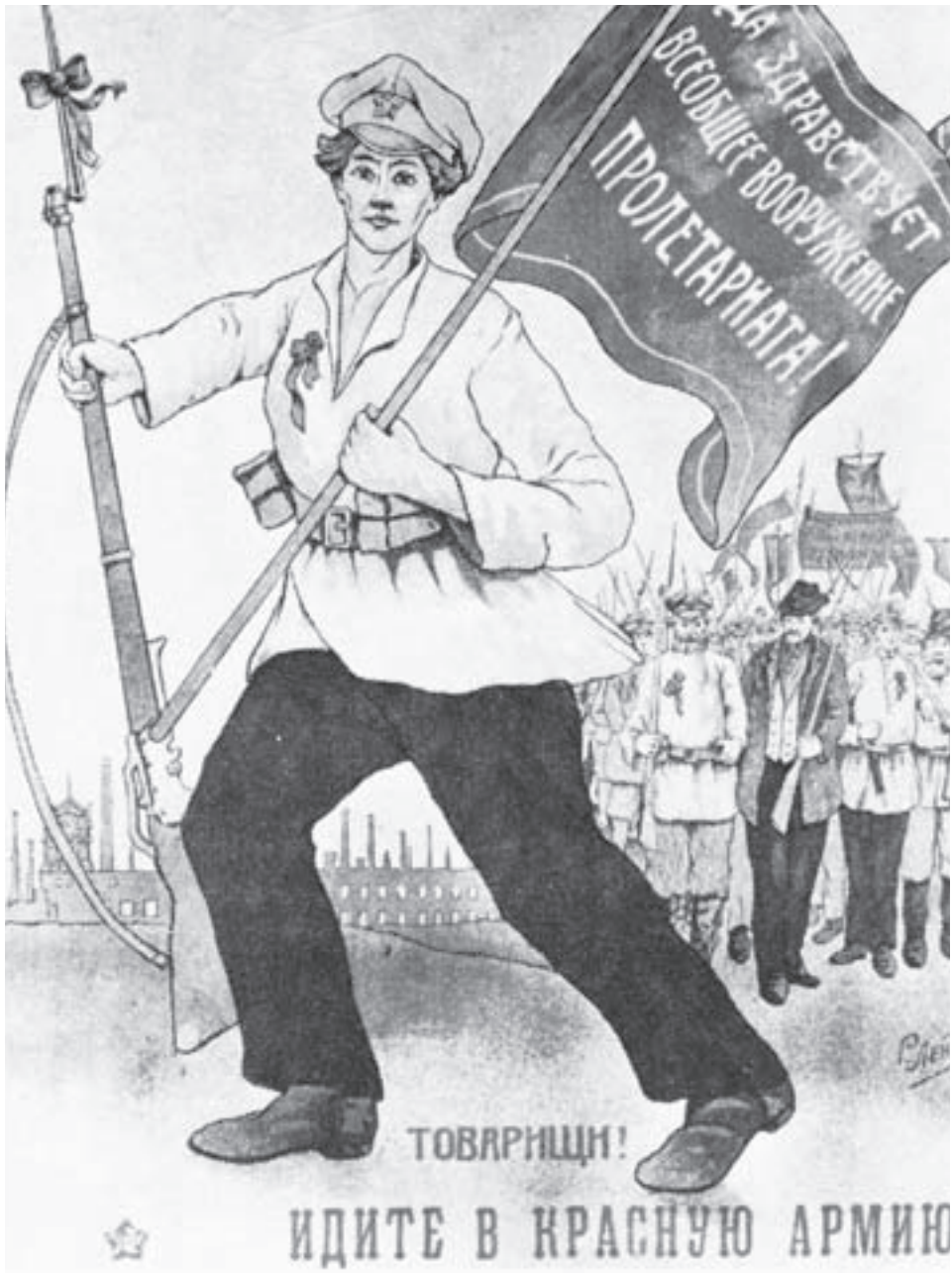
Puna-armeijan värväysjuliste. Lipussa lukee: "Eläköön proletariaatin yleinen asevelvollisuus".