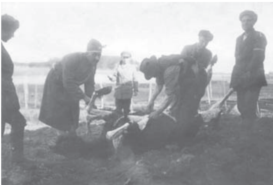
Valkoisten vartiomia punaisia sotavankeja paloittelemassa hevosenraatoa Pakkalassa 6.4.1918. Sotavankeja käytettiin myös yleisesti hautaamaan kuolleiden tovereidensa ruumiita joukkohautoihin.