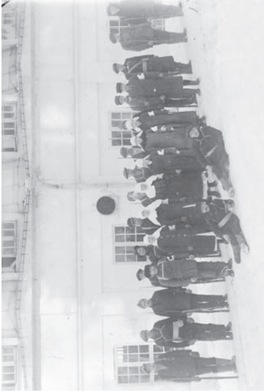
Ensiavun punaisia sairaanhoitajia venäläisimallisissa univormuissaan keväällä 1918. Ideologisesta taustastaan huolimatta hoitajatret muistuttavat päähineissään nunnia.