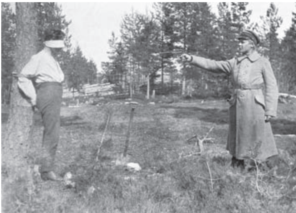
"Teloitus Virroilla" lukee tässä valokuvassa, jonka aitoudesta ei ole varmuutta.