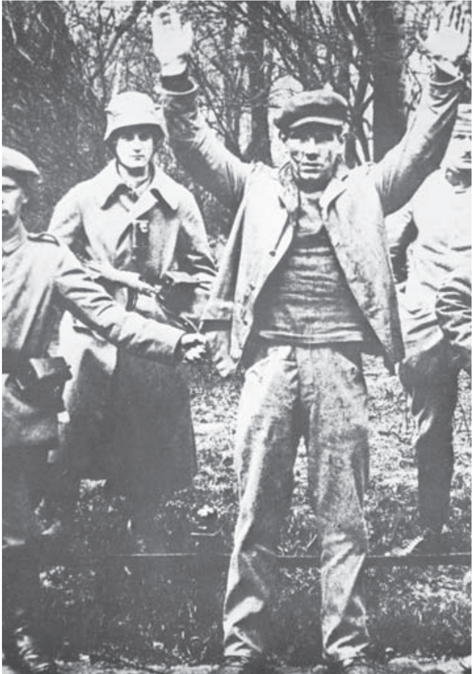
Vapaajoukot vangitsemassa Münchenin lyhytaikaisen neuvostotasavallan puolustajaa keväällä 1919.